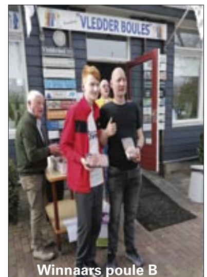
Winnaars poule B