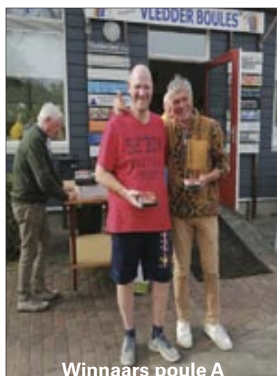
Winnaars poule A

Om 16,30 uur waren alle partijen gespeeld en kon worden begonnen met de uitreiking van de prijzen, traditie getrouw vleespakketten. Het was tevens het einde van een ongelooflijke sportieve sportdag waar geen wanklank werd gehoord, op naar het volgend jaar.